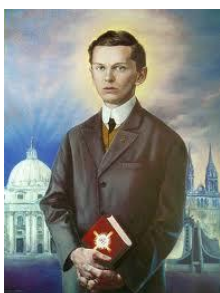
bl. Ivan Merz (19.-20. st.)

Blažena s. Marija od Propetog (Raspetog) Isusa Petković, rođena je u Korčuli. Umjesto bogate karijere kao odlična i marljiva učenica, posvećuje se redovničkom pozivu. Osnovala je izvorno hrvatsku družbu za služenje siročadi i siromašnoj djeci i mladima (Družba Kćeri milosrđa). Već za njezina života ova se družba proširila diljem svijeta. Bl. Ivan Pavao II. za posljednjeg pohoda Hrvatskoj 6. lipnja 2003. godine proglasio ju je blaženom.