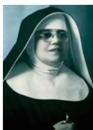
bl. s. Marija Propetog Petković (19.-20. st.)

Blaženi Alojzije Stepinac, rođen u Krašiću, vrlo rano, već s 36 godina postaje zagrebački nadbiskup. Na njegov prijedlog osnovan je Caritas Zagrebačke nadbiskupije. Uz neumorni rad i pobožnost istaknuo se u obrani ugroženih ljudi (doba II. svj. rata i poraća). Premda nevin, u montiranom komunističkom procesu osuđen je na 16 godina zatvora. Ondje je podnio svoje mučeništvo za Crkvu i Domovinu.